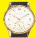
I.W.C. SCHAFFHAUSEN Acél: akár 250 000 Ft Arany: akár 500 000 Ft