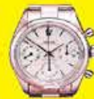
ROLEX OYSTER CHRONOGRAPH Acél: akár 1 000 000 Ft Arany: akár 1 500 000 Ft