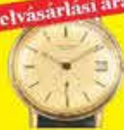
PATEK PHILIPPE Arany: akár 4 000 000 Ft Acél: akár 2 000 000 Ft