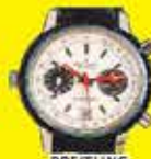
BREITLING CHRONOGRAPH 1900-AS ÉVEK Acél: akár 200 000 Ft Arany: akár 500 000 Ft